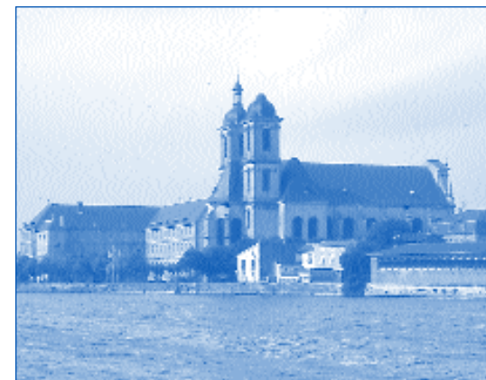
Centre culturel des Prémontrés

envisager que des collaborations se développeront au service des acteurs culturels locaux (formation de formateurs, résidences d'artistes, ...)