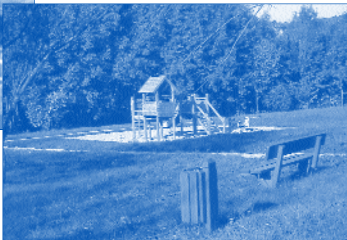
Accueil éducatif des jeunes enfants